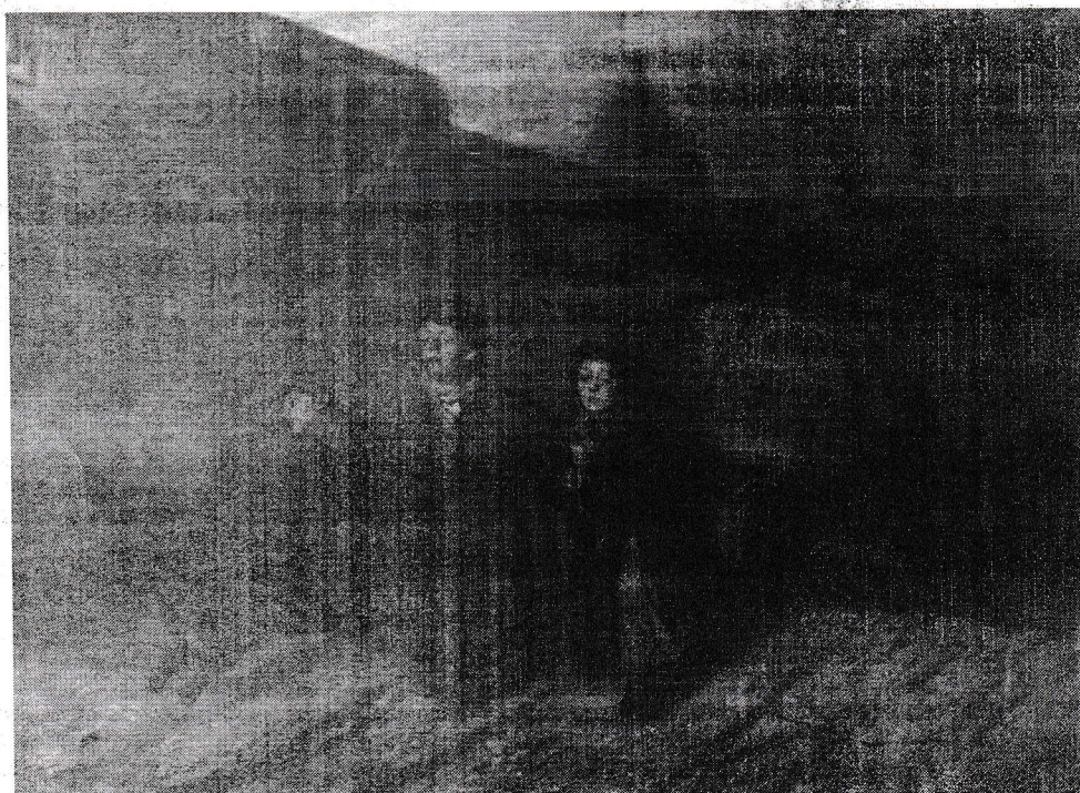
В. Перов. «Тройка»

Выберите из предложенных статей Конвенции о правах ребёнка ту статью, которая нарушена. Ответ укажите цифрой.