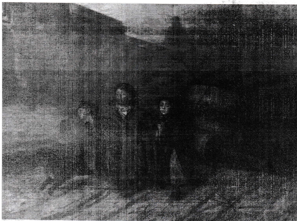
В. Перов. «Тройка»

Выберите из предложенных статей Конвенции о правах ребёнка ту статью, которая нарушена. Ответ укажите цифрой.